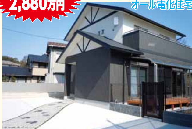
綺麗なお家です是非ご覧下さい。

※H24.12.2,980万円 2,880万円 100万円値下げしました!! オール電化住宅